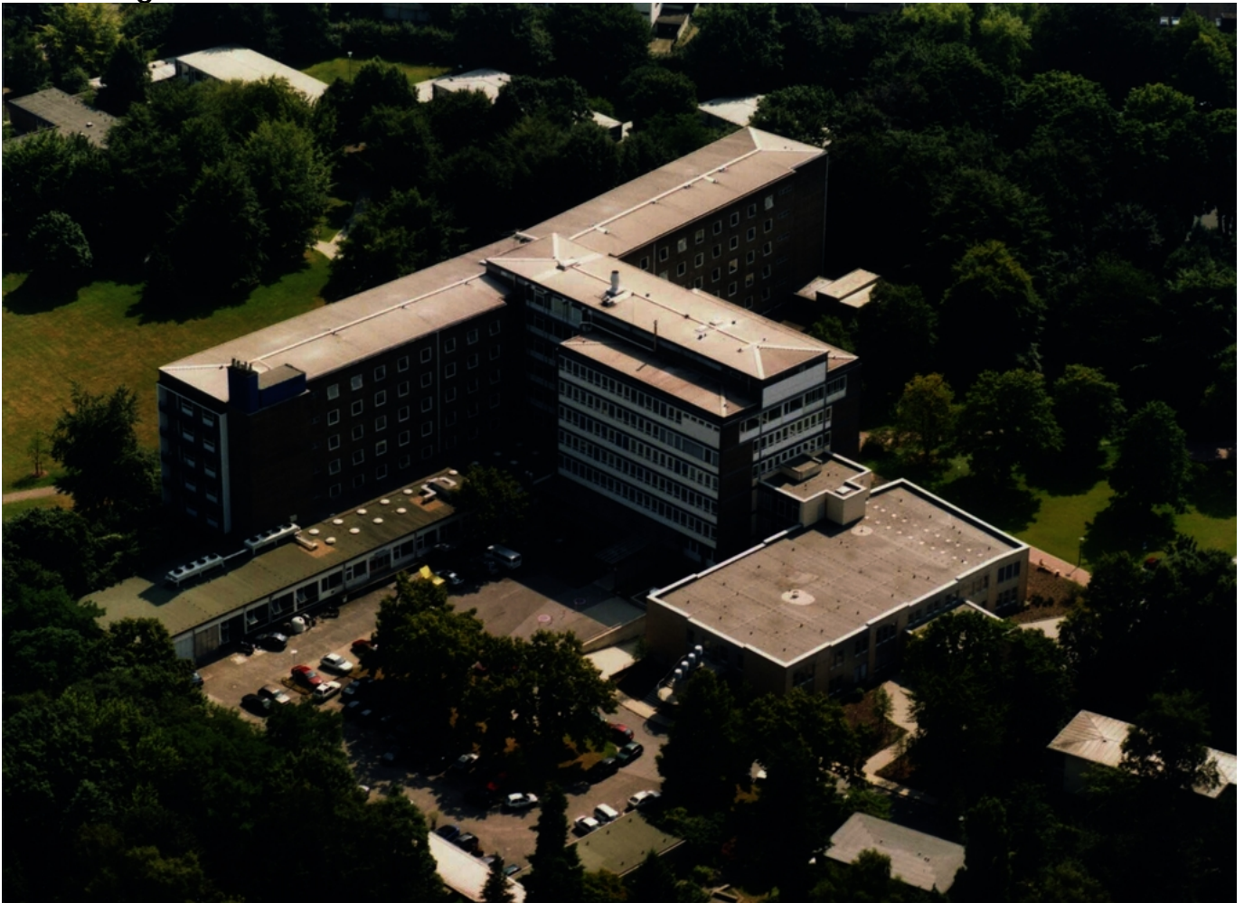
Abbildung: Sana Krankenhaus Benrath

Für die Erstellung des Qualitätsberichts verantwortliche Person: